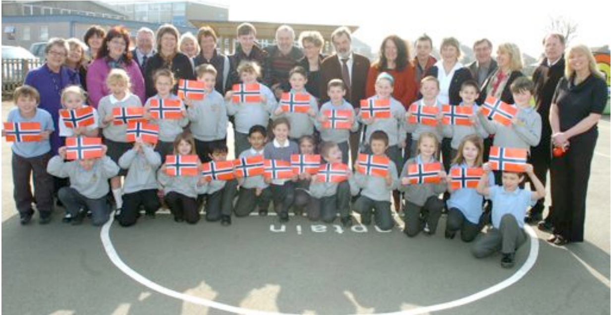
Vi vart særst godt mottekne av elevar og lærarar på Thingwall school. Foto som vart tatt av journalistar frå The Wirral News. (Heile artikkelen ifrå The Wirral News ligg som vedlegg til rapporten).